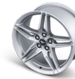
ล้ออัลลอยอะลูมิเนียมแบบ Forged ขนาด 19" x 9" (Pre-Order) ล้ออัลลอยอะลูมิเนียมแบบ Forged ขนาด 19" x 9.5" (Pre-Order)