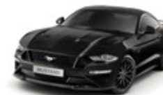
Shadow Black Metallic