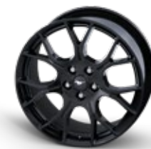
EcoBoost Performance pack wheel