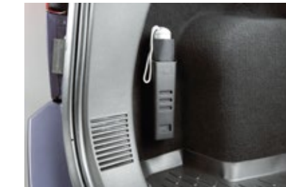
ที่เก็บรถ