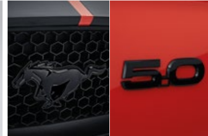
Mustang badge และ 5.0 badge สีดำ (Pre-Order)