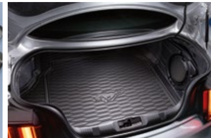
ถาดใส่ของท้ายรถ