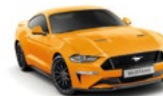
Orange Fury Metallic Tri-Coat