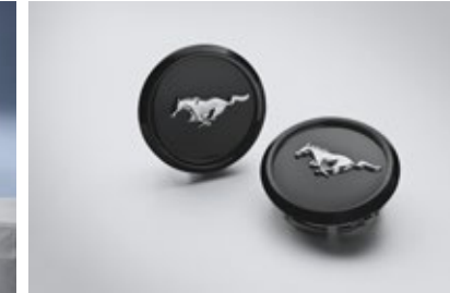
ชุดฝาครอบล้อ Mustang