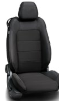
เบาะหนังสีดำ (Ebony leather)