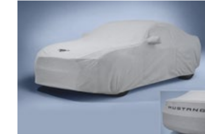
ผ้าคลุมรถ Mustang