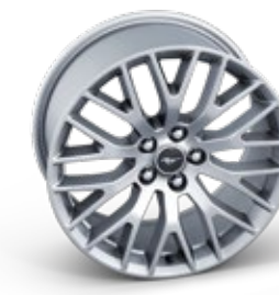
ล้ออัลลอยอะลูมิเนียมคู่หน้า ขนาด 19" x 9" (Pre-Order) ล้ออัลลอยอะลูมิเนียมคู่หลัง ขนาด 19" x 9.5" (Pre-Order)