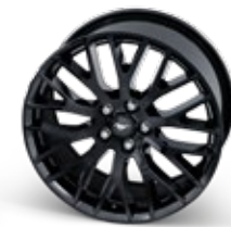
5.0L V8 GT Performance pack wheel